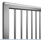
Rundstab Ø 25 mm