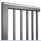
Stab 30 x 30 mm

Das HOLLER PRO Schiebetor Classic ist in verschiedenen Ausführungen standardmäßig lieferbar.