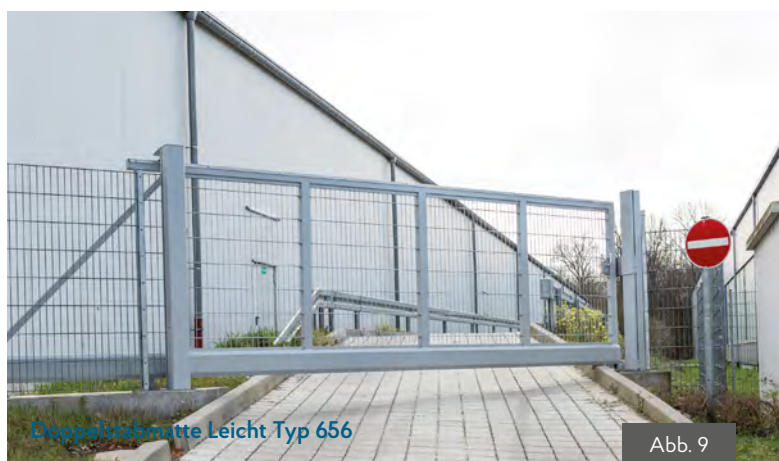
Doppelstabmatte Leicht Typ 656