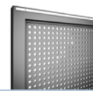
Lochblech Ø 10 mm Ø 20 mm