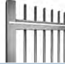
Durchgesteckter Rundstab Ø 25 mm