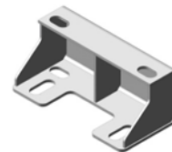
Unterstellböcke in verschiedenen Höhen