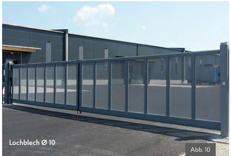
Lochblech Ø 10