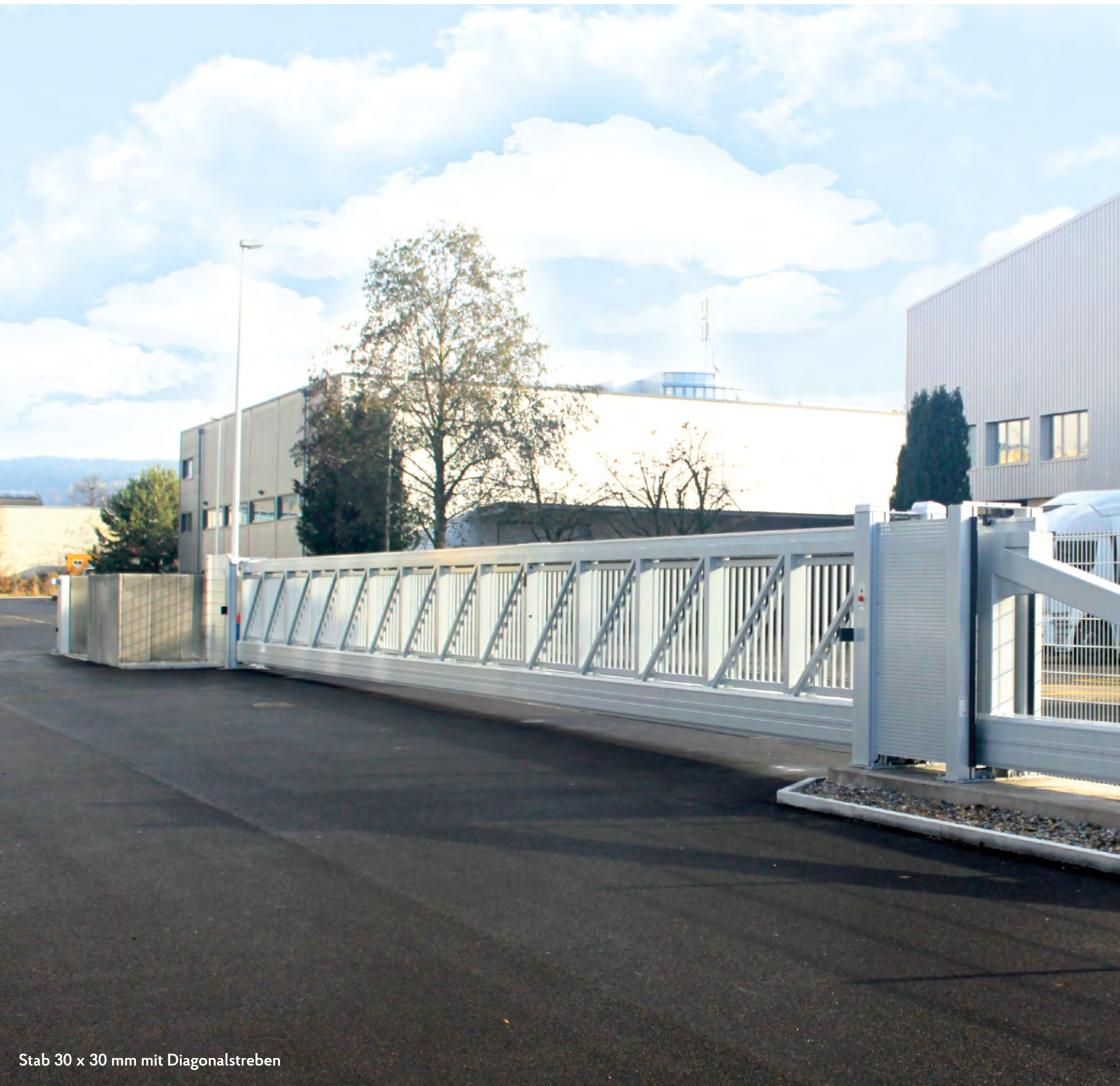
Stab 30 x 30 mm mit Diagonalstreben