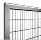
Doppelstabmatte Schwer Typ 868