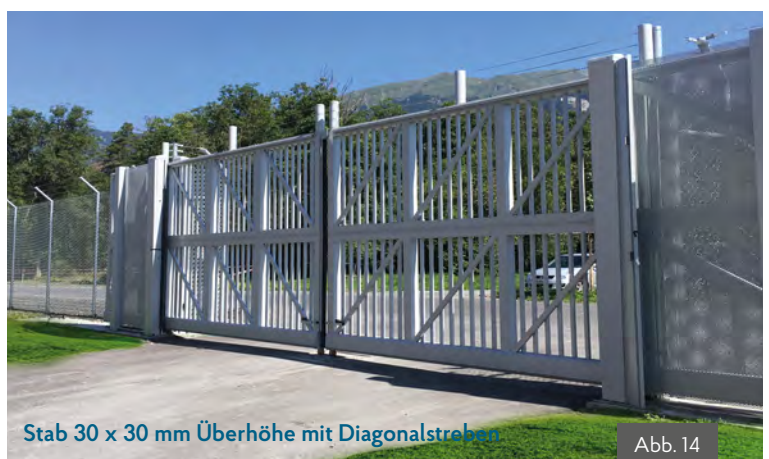
Stab 30 x 30 mm Überhöhe mit Diagonalstreben