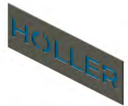
Lasercut mit Blech, farbig hinterlegt