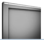
Glattblech 2 mm