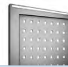
Lochblech 10 mm 20 mm