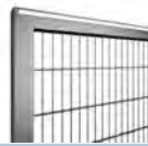
Doppelstabmatte Leicht Typ 656