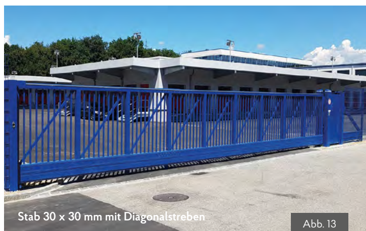
Stab 30 x 30 mm mit Diagonalstreben