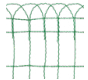
Drahtstärke: 2,5 und 3,1 mm