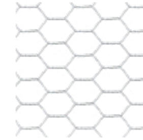
Drahtstärke: Ø 1,0–1,6 mm