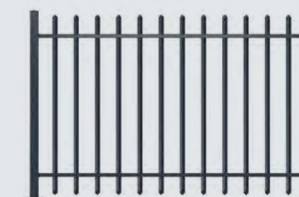
Quadratrohr spitz „Basic“